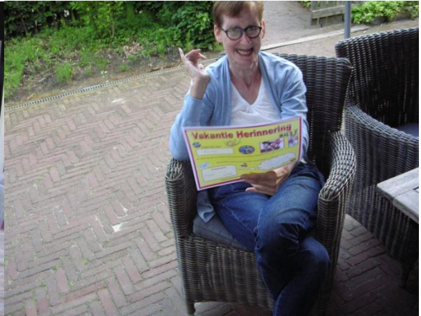
Hannie houdt van winkelen